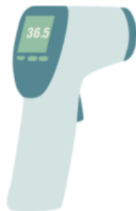
MEDICAÇÃO DE TEMPERATURA