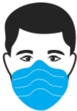
USO DE MASCARA