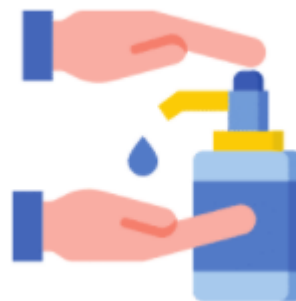
ALCOOL EM GEL